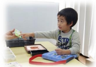
コミュニケーション指導